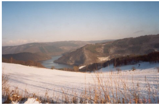
Rursee, Eifel: In dieser abgelegenen Talgegend fanden die Täufer Ruhe vor ihren Verfolgern

Das Eifeler Land ist bis heute eine überwiegend katholische Gegend, auch wenn es nur noch wenige fromme Katholiken gibt, die in der Lehre ihrer Kirche leben. Es existieren viele religiöse Bräuche und Traditionen, deren tiefere geistliche Bedeutung oft nicht mehr erkannt wird. Dieses von Tradition und Brauchtum formalisierte Christentum ist leider oft zu einem bibellosen Christentum mutiert, in dem das Wort Gottes keine Rolle mehr spielt, ob wohl es doch nützlich zur Belehrung, Überführung, Zurechtweisung und Erziehung in der Gerechtigkeit ist. 2. Tim. 3:16.